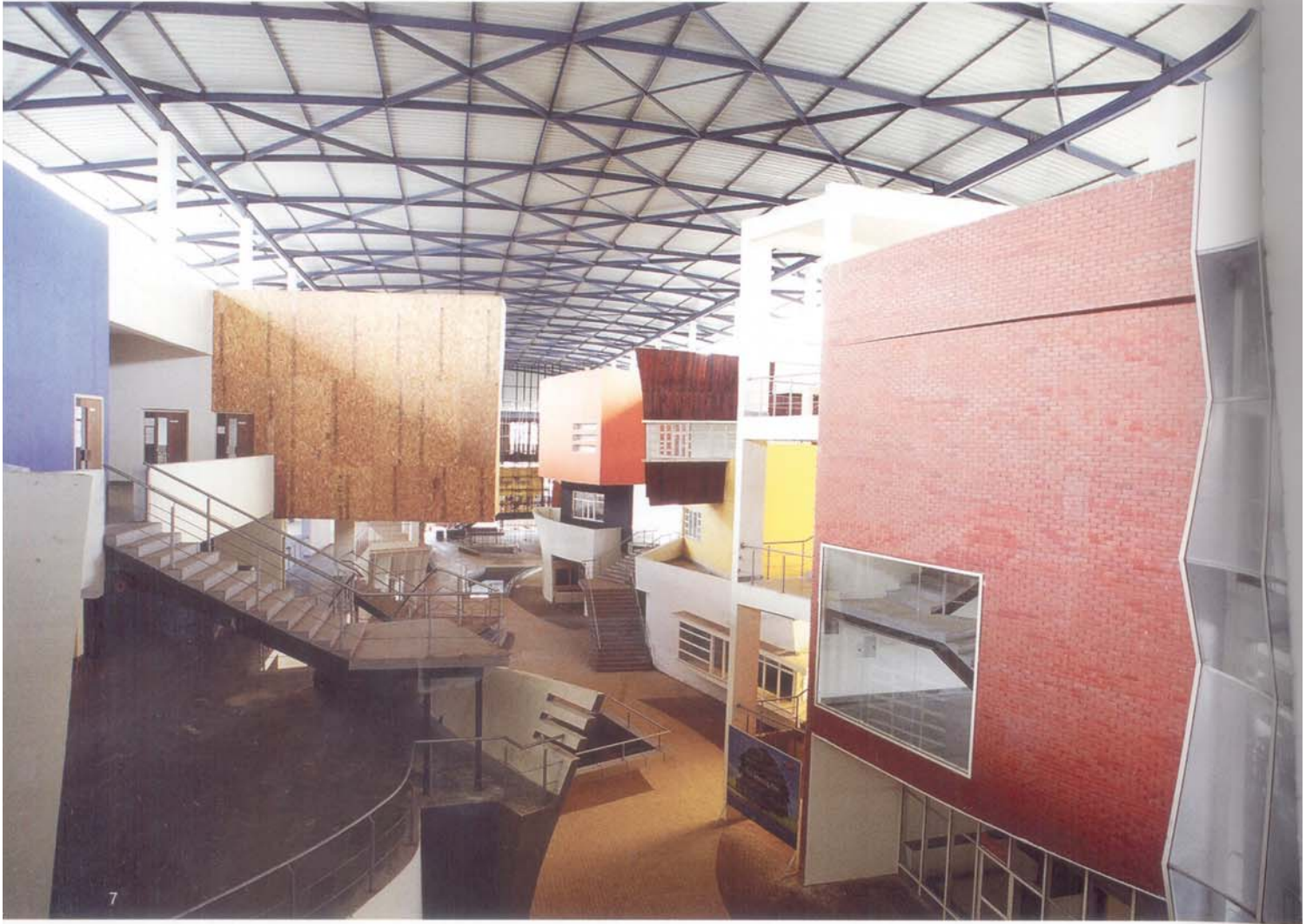
7, 8. 어느 한 곳도 지루한 감이나 식상함 없이 독특한 형태로 설계되어 학생들의 상상력을 자극한다.