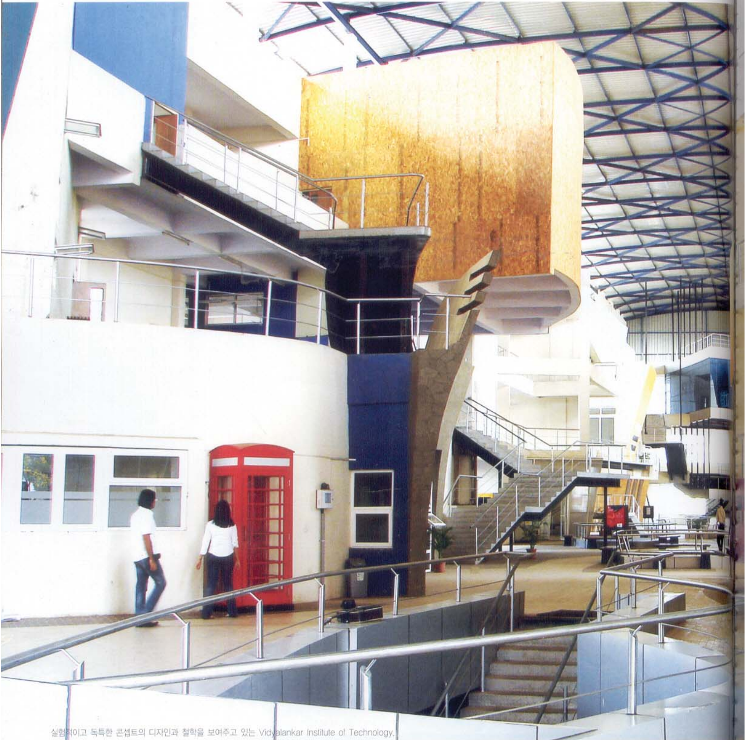
실험적이고 독특한 콘셉트의 디자인과 철학을 보여주고 있는 Vidyalankar Institute of Technology.

에디터 김민영 desk@decojournal.co.kr 위치 인도, 뭍바이