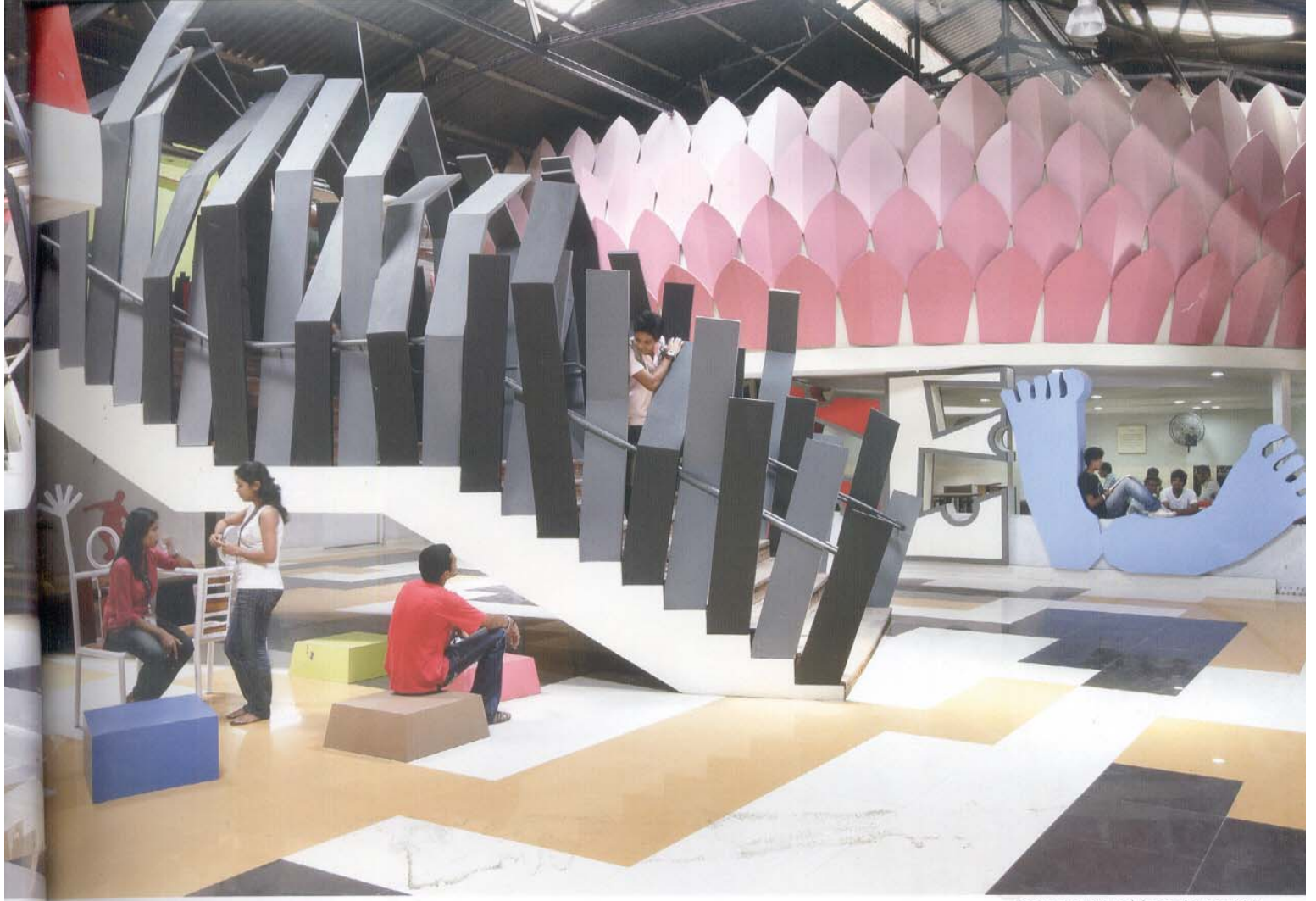
Staircase viewed from the corridor